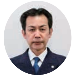
日立市消防長 綿引 学