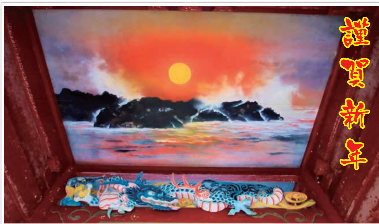
御岩神社 楼門の天井画「日天月天図」(にってんがってんず)

■ 2024年1月1日発行 第117号 ■ 発行 日上市防災協会 事務局 日上市神峰町2-4-1 (日上市消防本部内) TEL 22-0727 FAX 22-0727