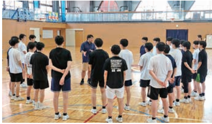
女子バスケットボール部の指導

また2020年からおよそ3年半に渡り私たちの生活を大きく変えたコロナ禍も、昨年には5類に引き下げられ世の中も以前の活気を取り戻してまいりました。そういった意味では皆様も4年ぶりに明るい気持ちで年越しができたのではないでしょ