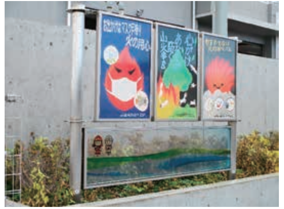
南部消防署のポスター掲示板

また、遡る事14年前に北海道スキー旅行に行った際、現地にて不格好なスキーをしていた娘へ「現地の消防署員で少年団にスキーを教えている」という方から手ほどきを被り、帰宅後に娘直筆の礼状をお送りし、それ以来家族ぐるみのお付き合い。そんな愚女には「人と人を繋ぐ仕事に就いてもらいたい」と願いましたところ、今では市職員として市民の皆様にも注力する職に就き日々奮闘しています。 続きまして愚息のお話し。2011年3月11日の東日本大震災の日、卒業式を終えた2日後、学校前の飲食店に集合し開店を待っていた最中にあの大地震！即体育館に入り避難者の誘導や手助け、または地面を掘り