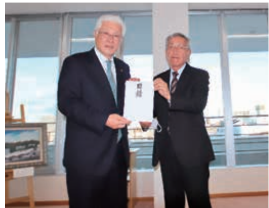
小川市長と宮内会長