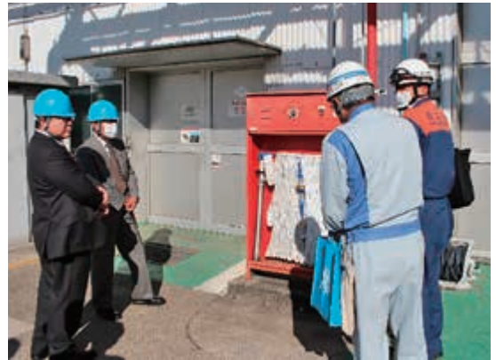
(株)レゾナック山崎事業所様

厳正なる審査の結果、全ての事業所様が優良でした。4事業所様、並びに審査員の皆様、お忙しい中、御協力ありがとうございました。