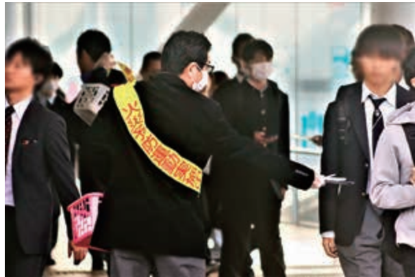
マスク・ポケットティッシュの配布