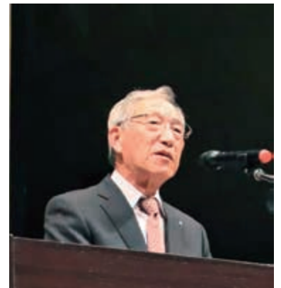
挨拶をする宮内会長

9月に発生した台風13号に伴う記録的な大雨を経験したことや、関東大震災から100年の節目ということで、国立研究開発法人防災科学技術研究所、マルチハザードリスク評価研究部