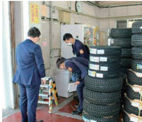
茨城トヨペット (株) 日立田尻店様