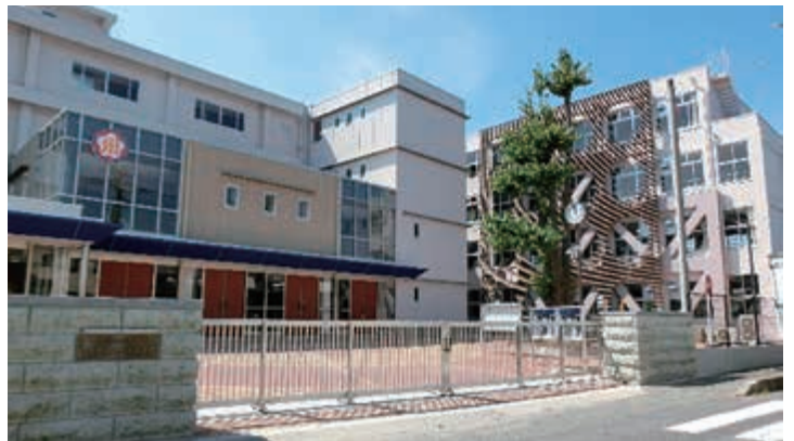
明秀学園日立高等学校正門