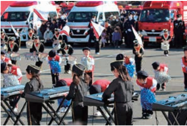
おぎつ幼稚園の鼓笛隊ドリル演技