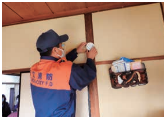
住宅用火災警報器取り付けの様子

を回り、電気やガスなどの屋内の点検や火災などの注意を呼びかける事業)に活用していただき、火災による被害を少しでも減らすために、住宅用火災警報器100個を社会福祉協議会へ寄附しました。