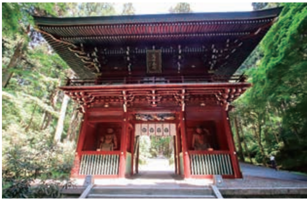
楼門の中には阿形像と吽形像が鎮座

の遙か昔、縄文晩期の頃より、 神坐す聖なる霊山として、人々 から畏敬の念を集めてまいりま した。 御岩山の長い歴史において、 栄枯盛衰は世の習い、時代によ り様々な困難がありながら、信 仰は途切れることなく、貴重な 文化財も先人たちの祈りと共に 引き継がれています。その昔、 神事は生活の営みの一部に組み 込まれ、神社は地域文化や文化 財を次代に継承していく場でも ございました。その役割は今も 変わりません。