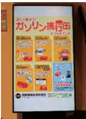
ヒタチ内幸ステーション前のデジタルサイネージ