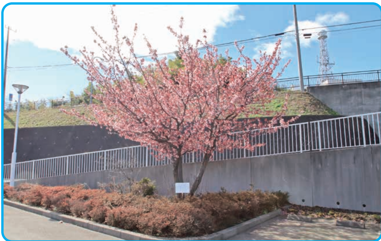
日上市消防本部内の日立紅寒桜

■ 2024年7月1日発行 第118号 ■ 発行 日上市防災協会 事務局 日上市神峰町2-4-1 (日上市消防本部内) TEL 22-0727 FAX 22-0727