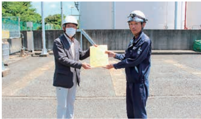
三和エナジー(株)様