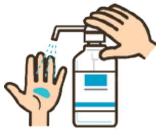
火気の近くでの取り扱いには注意しましょう。

毎週6月第2週の「危険物安全週間」において、新型コロナウイルス感染症の感染リスクを軽減するため、消防本部予防課が主体となり、市内全域において、危険物広報車を使用した広報と会員事業所への危険物の保