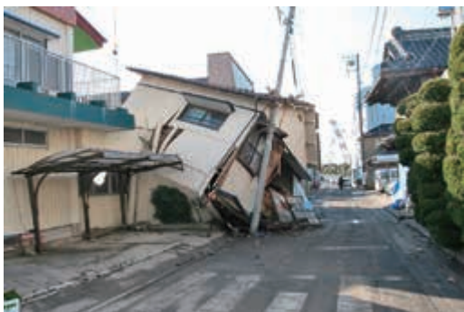
東日本大震災による被害状況