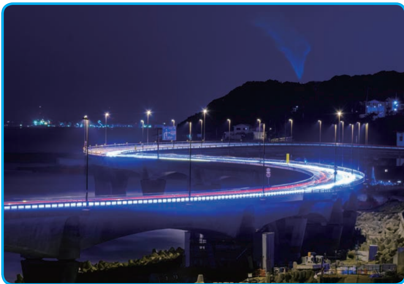
S字に沿って車の光跡が鮮やかな「日立シーサイドロード」

■ 2021年7月1日発行 第112号 ■ 発行 日立市防災協会 事務局 日立市神峰町2-4-1 (日立市消防本部内) TEL 22-0727 FAX 22-0727