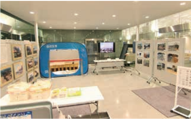
市役所庁舎での展示状況