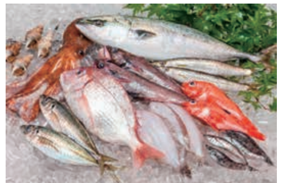
シーフードショップトビタ

平成13年にオープンした、日立市大和田町のひたち南ドライブインは株式会社飛勘水産の直営店です。 「シーフードショップトビタ」は、日立市久慈漁港で水揚げされた、アンコウ、メヒカリ、アナゴなどの地元ならではの商品や各地の魚介類を取り揃えております。 ほかにも精肉や青果も販売しております。