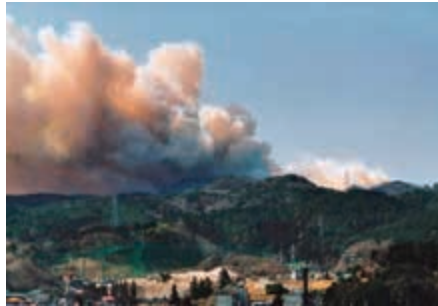
平成3年の林野火災の様子

森林は私たちの生活に必要な水を貯えるなどの大切な役割を果たしていますので、火災などで森林が失われると、その大切な機能が回復するまでには長い年月がかかります。貴重な自然や財産を守るためにも火の取り扱いには注意するようにしてください。