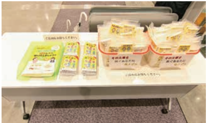
市役所庁舎での火災予防啓発品の配布