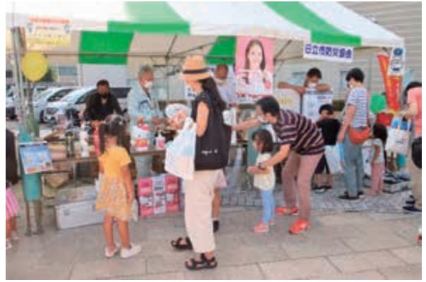
日立市防災協会の出店ブース

また、一日消防署長として助川中学校3年生が委嘱され、来場者に火災予防を呼び掛けました。