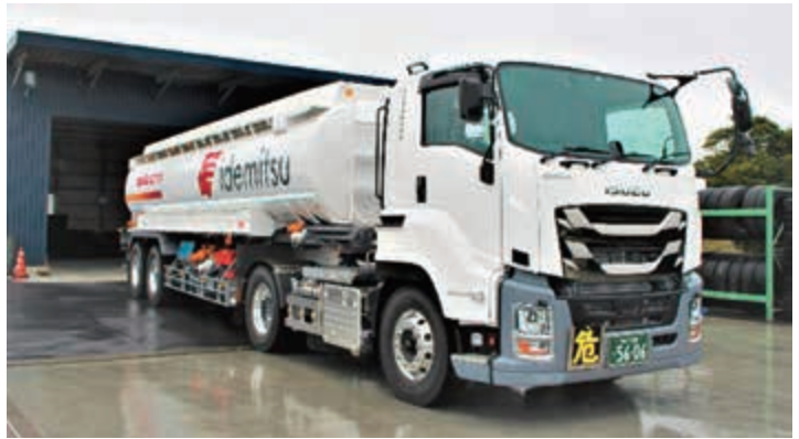
最大の26klのトレーラー