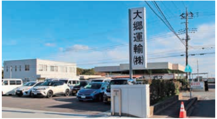
留町地内の大郷運輸株

大郷運輸には、親身になってくださる先輩方が大勢おり、優しい先輩方のもと、毎日楽しく仕事をしています。 「率先垂範」を座右の銘とし、今後も率先して行動ができる人材になっていきたいです。 仕事での今年の目標は、トレーラーに乗れるようになったので、26キロリットル車（大郷運輸で運行する最大のトレーラー）も乗れるようになります。 プライベートでは、休みの日に妻と買い物をしたり、おいしいランチ巡りをすることが楽しみです。