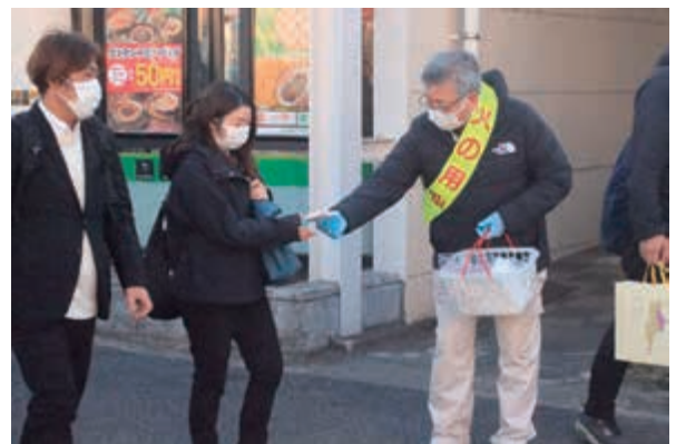
マスク・ポケットティッシュの配布