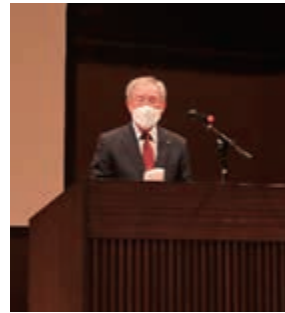
挨拶をする 宮内会長

令和4年12月2日(金)に日立シビックセンター音楽ホールにおいて、日立市防災協会防災研修会を行いました。