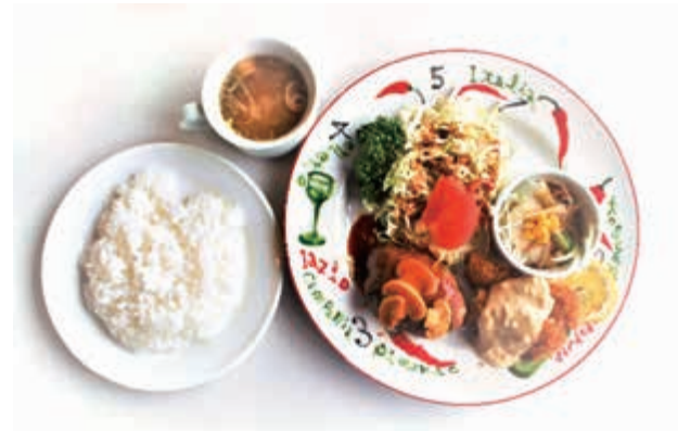
ボリュームのある日替わりランチ

清海のメニューは、ファンの多い手捏ねハンバーグやステーキなど、丁寧に手作りしたものがばかりです。私の妻や息子は、自家製デミグラスソースやドリアの自家製ホワイトソースは、清海が一番美味しいとお墨付きです。