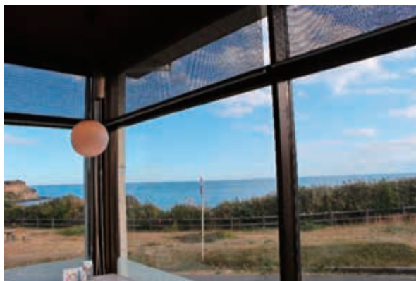
太平洋を一望できる店内

レストラン清海は昭和49年開業の洋食レストランです。大甕駅近くの国道245号線沿いに位置し店内からは太平洋が一望できます。