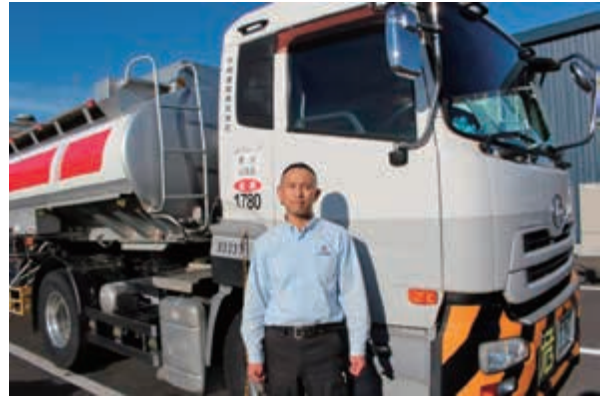
タンクローリーの前で

嫌な顔を見せずに、いつも応援してくれていたのは妻でした。約2年家を離れ、子供達にも寂しい思いをさせましたが、大郷運輸の仲間に入れてもらい、今は充実感でいっぱいです。