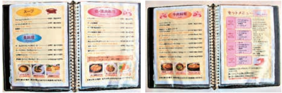
豊富なメニューです。

清海のメニューは、ファンの多い手捏ねハンバーグやステーキなど、丁寧に手作りしたものがばかりです。私の妻や息子は、自家製デミグラスソースやドリアの自家製ホワイトソースは、清海が一番美味しいとお墨付きです。