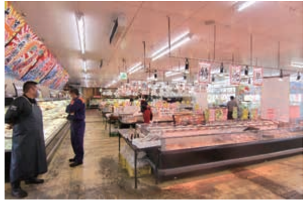
店内の状況を確認中

審査会に御協力いただきました事業所は次のとおりです。 ・(株) 八幡鉄工所 様 ・(有) オートリサイクルまるしん 様 ・ひたち南ドライブイン 様 ・出光興産(株) 様 ・日立油槽所 様 御協力ありがとうございました。