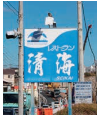
青い看板が目印です。

レストラン清海 ・日立市大みか町4丁目14番13号 ・0294-53-3637 ・instagram seikai3637